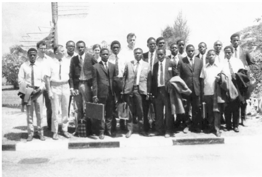
Abbildung 4.1: Tansanier auf dem Weg zur Berufsausbildung in der DDR werden auf dem Flughafen Dar es Salaam von DDR-Botschaftspersonal verabschiedet, Fotografie, 11. 1. 1974.

großen Bedeutung des Staates und dem hohen Prestige des Beamtentums wenig erstaunlich – der Dienst für die eigene Regierung das höchste Ziel. 90 Der Wunsch, die Karriereleiter zu erklimmen, wurde auch verknüpft mit Entwicklungszielen und Visionen einer wissenschaftlich verbesserten Moderne, wie am Beispiel eines selbst verfassten Lebenslaufs aus dem Jahr 1968 deutlich wird: