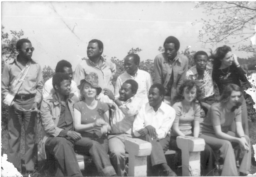
Abbildung 4.2: Fotografie von Mitgliedern der Musikgruppe „Ensemble Solidarität“ der Karl-Marx-Universität aus Tansania, Südafrika, der DDR und Griechenland

(wenngleich nicht der Überzeugungen). Ähnliches in Bezug auf die zeitweilige Stilllegung religiöser Praktiken berichteten muslimische InterviewpartnerInnen. 100 Im Fall von zwei ehemaligen Doktoranden in der BRD wurden Doktorvater bzw. Doktormutter als enorme Stützen gelobt, die die gerade frisch eingetroffenen Studierenden oft zu sich nach Hause einluden oder sogar anfangs bei sich wohnen ließen, Flüge zur Familie nach Tansania bezahlten und insgesamt eine Zuneigung ( upendo ) zeigten, als wären sie Verwandte. Hier handelte es sich um Lehrende, die zuvor bereits in Tansania gelebt und an der Universität Dar es Salaam unterrichtet hatten und ihre Betreuungsfunktion offensichtlich bis tief die private Sphäre ausweiteten, was als großer Unterschied zum distanzierten Betreuungsverhältnis in Tansania erfahren wurde. 101