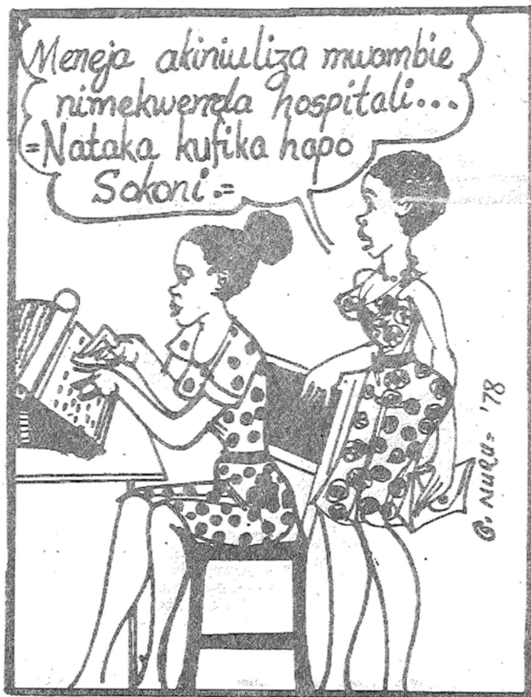
Abbildung 2.2: Karikatur zum Thema Arbeitsdisziplin aus dem Organ der Einheitsgewerkschaft JUWATA. Der Sprechblasentext: „Wenn der Chef (/die Chefin) nach mir fragt, sag ihm (/ihr) ich bin ins Krankenhaus gegangen... Ich will zum Markt.“ (Quelle: Mfanyakazi 686, 5. 8. 1978, S. 8)

wurde in Karikaturen unmoralisches Verhalten unterstellt (Abbildung 2.2). 66 Auch die Frauenorganisation der Partei, die UWT, trat mit Disziplinierungsrhetorik in