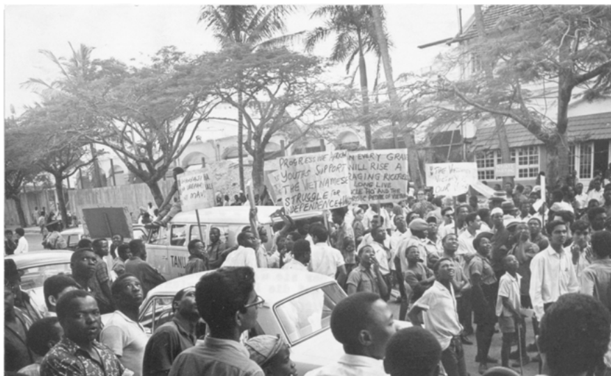
Abbildung 2.1: Proteste im Sinne des antiimperialistischen Entwicklungsstaates: Studierende und Jugendliche protestieren vor der US-Botschaft gegen den Vietnam-Krieg und Kapitalismus. Fotografie, Dar es Salaam, 31.7.1968

fenbarte sich in Demonstrationen gegen die USA und den Vietnamkrieg (Abbildung 2.1) ebenso wie in Protesten gegen den Einmarsch der Sowjetunion in die ČSSR. Die Partei versuchte, den Aktivismus der Jugend zu kanalisieren. Viele Proteste wurden von der TANU oder der Jugendorganisation initiiert oder unterstützt (siehe das Fahrzeug mit der Aufschrift „TANU“ in der Abbildung) und von entsprechenden Stellungnahmen in den Medien flankiert. 50 Regierung und Massenorganisationen zielten darauf ab, das politische Potenzial der Jugend zu monopolisieren. Die jugendliche Avantgarde sollte ihre Energie in Übereinstimmung mit nationalstaatlichen Interessen einsetzen. Erscheinungen der „Dekadenz“, des eigennützigsten Materialismus und Karrierismus galten der Führungsschicht als moralische und nationsgefährdende Übel; ebenso die radikalen linken Strömungen an der Universität, die wiederholt die Legitimität der Elite infrage stellten. 51