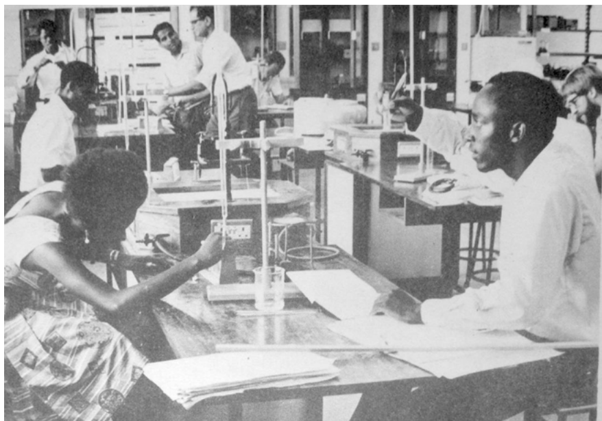
Abbildung 7.1: Chemiepraktikum für SekundarschullehrerInnen

offensichtlich nahelegt, dass hier expatriates den tansanischen Prinzipien und Strategien Folge leisten. Auch Bildunterschriften anderer Fotografien in den Universitätsberichten gehen nicht darauf ein, dass Lehrkräfte mit nicht-tansanischer oder zumindest nicht-afrikanischer Herkunft abgebildet sind. Derartige Bilder spiegeln in erster Linie die Perspektive der nationalen Elite: Expatriates hatten Erfüllungsgehilfinnen für das self-reliance -Vorhaben zu sein, die Studierenden sollten diszipliniert lernen und sich ebenso wie das Lehrpersonal in den Dienst des Staates und der nationalen Entwicklungsaspirationen stellen.