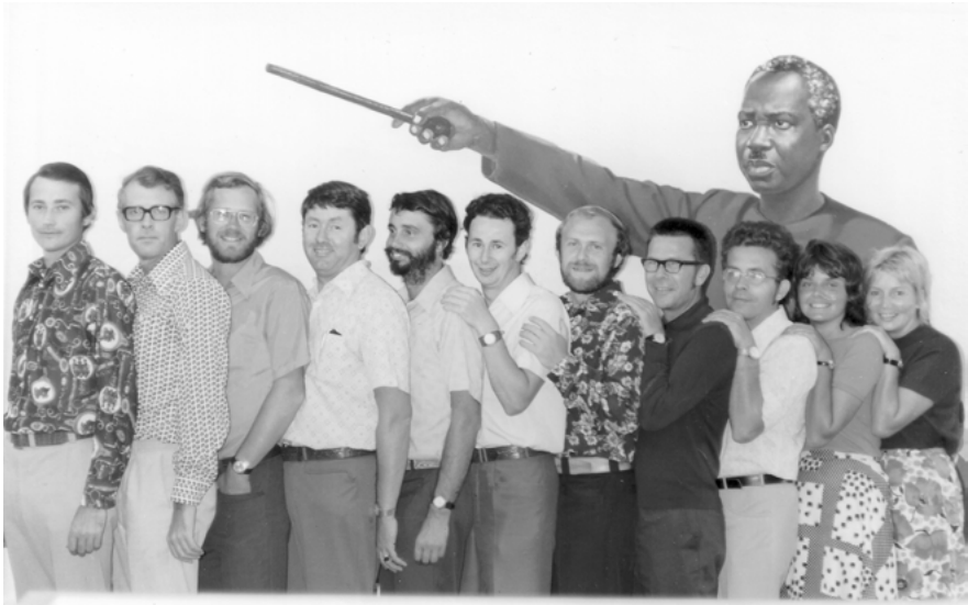
Abbildung 5.1: In Diensten zweier Sozialismen: DDR-LehrerInnen vor einem Wandgemälde des tansanischen Präsidenten Julius Nyerere. Das Bild wurde anlässlich eines Lehrerseminars mit tansanischen KollegInnen im August 1975 in Dar es Salaam aufgenommen.

rückzuweisen. Die Botschaft, die die jeweils geltende Doxa aus Ostberlin weiterleitete, kam mit der Unterweisung der Auslandskader nicht mehr nach. 395