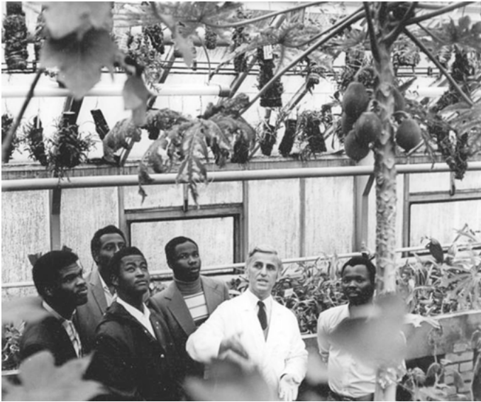
Abbildung 4.3: Darstellung des einseitigen Wissenstransfers im Botanischen Garten in Leipzig, 22.9.1973. Unter den fünf afrikanischen Studenten befindet sich ein Tansanier.

freiwilligen Teilnahme angehalten – wenn auch mit wenig Erfolg. 123 In der Fachrichtung Tropische Landwirtschaft – eine der wenigen Studienrichtungen in der DDR mit überwiegend ausländischen StudentInnen – waren Prüfungen nicht nur in Genetik , Mathematischer Statistik und Bodenerhaltung abzulegen, sondern auch in den Fächern Agrarökonomie der DDR , Philosophische Grundfragen unserer Zeit , und Grundfragen der revolutionären Hauptströme unserer Zeit . 124 Die Letzteren waren stark durch marxistisch-leninistische Theorien geprägt. In Interviews wurde der verpflichtende Charakter derartiger Lehrveranstaltungen betont: „Man musste es machen“, „sonst hätte man exmatrikuliert werden können“, waren einige der verwendeten Formulierungen. 125 Zwei Interviewpartner erzählten, dass